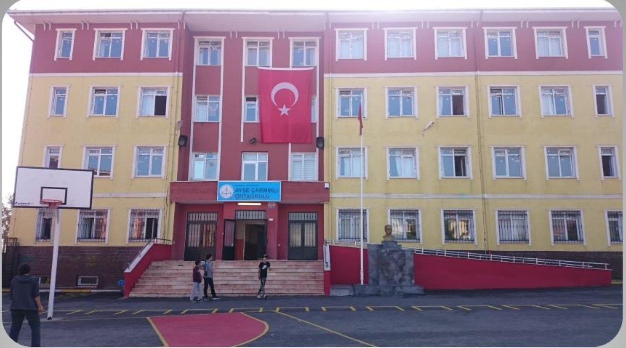
Ayşe Çarmıklı Ortaokulu